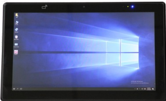
Vue de Face / vue arrière avec option batterie →